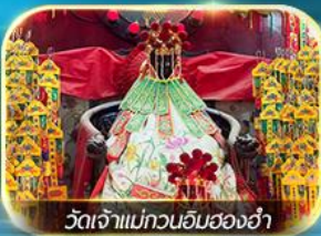
วัดเจ้าแม่ทวนอิมสองอ่า