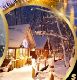
หมู่บ้านเทพนิยาย นิงเกิลเทอร์ส