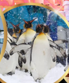
สวนสัตว์ อาซาฮิยาม่า