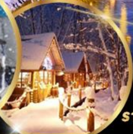
หมู่บ้านเทพนิยาย นิงเกิลเทอเรส