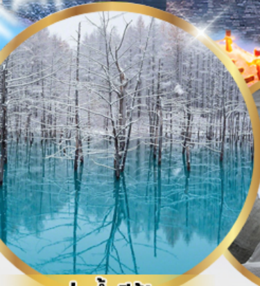
บ่อน้ำสีฟ้า