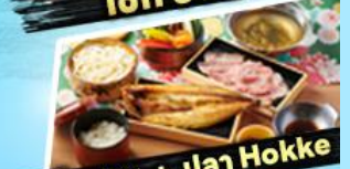
เซ็ทซาซุ + ปลา Hokke