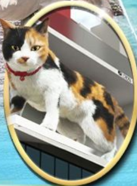
ซูปบิง ชินจูกุ

36,919 ราคาเริ่มต้น บาท รวมภาษีมูลค่าเพิ่ม 7%