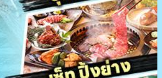
เซ็ท บิงยัง