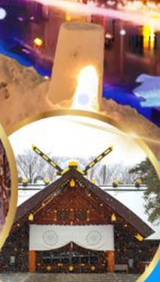
ศาลเจ้า ออกโทโต

เดินทาง 04 - 09 กุมภาพันธ์ 68 05 - 10 กุมภาพันธ์ 68