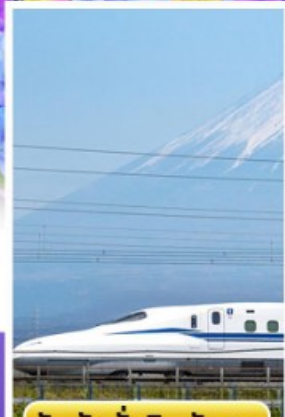
สัมผัสนั่งชินคันเซน