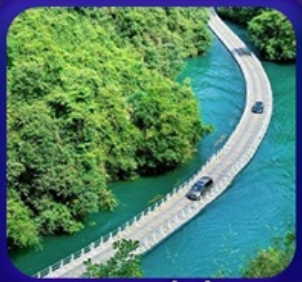
“ หุบเขาสิงโต ซื่อจื่อกวน ”