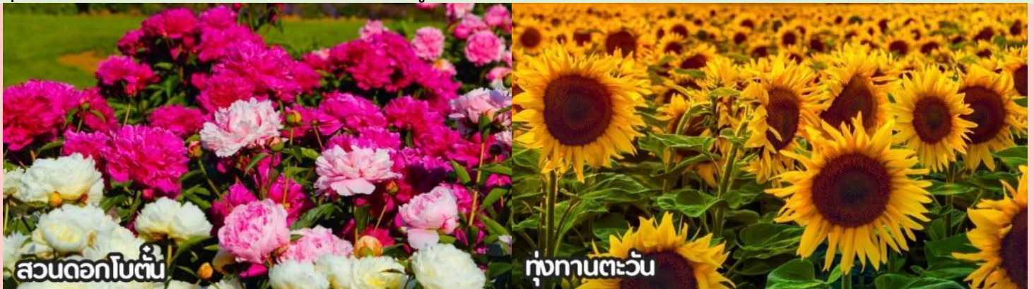
สวนดอกโบตั๋น

เดือนสิงหาคม-ต้นกันยายน ชมทุ่งดอกเบญจมาศหรือดอกไฮเดรนเยีย ดอกเบญจมาศปักกิ่งหมายถึงสายพันธุ์เบญจมาศที่มีต้นกำเนิดหรือนิยมปลูกในกรุงปักกิ่ง ประเทศจีน โดยเฉพาะช่วงฤดูใบไม้ร่วง ที่มีการจัดงานมหกรรมดอกเบญจมาศ แสดงความหลากหลายของสีและรูปร่าง มีสายพันธุ์เช่น "กุสุ่ยจิ้นเสี่ย" ที่ได้รับรางวัลราชาดอกเบญจมาศ และยังมีเบญจมาศปักกิ่งสีขาวที่เป็นสมุนไพรด้วย ที่สำคัญคือเป็นดอกไม้ที่ใช้ในงานเทศกาลและวัฒนธรรม โดยเฉพาะในสวนสาธารณะ เช่น รือถาน และอุทยานเป่ย์ไห่ มีหลากหลายสี เช่น ขาว เหลือง ชมพู แดง และม่วง สามารถพบได้ในหลายพื้นที่