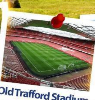
Old Trafford Stadium