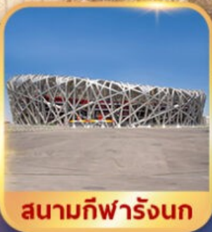
สนามกีฬาโอลิมปิก