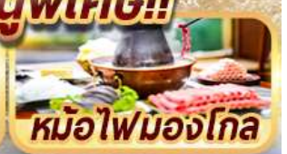
หม้อไฟมองโกล