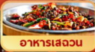
อาหารเสววน