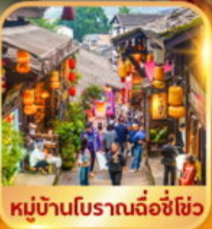
หมู่บ้านโบราณฉือชี่ฮั่ว