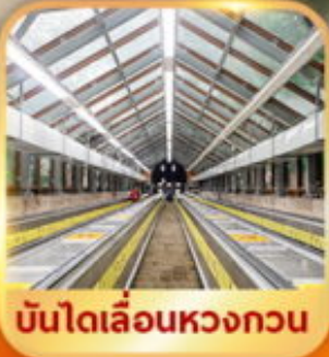
บันไดเลื่อนหวงกวน