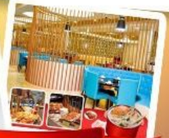
ก๊วยแม่น้ำ + HOTPOT SEAFOOD