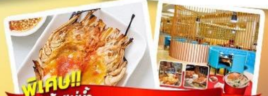
พิเศษ!! ก๊วยแม่น้ำ + HOTPOT SEAFOOD