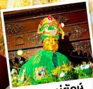
ซอพรแม่ยักย์