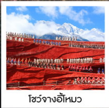
โซ่วจางอีไห่