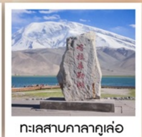
ทะเลสาบกาลากุเล่อ