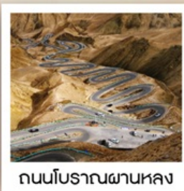
ถนนโบราณผานหลง