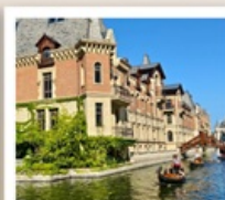
เวนิสแห่งต้าเหลียน