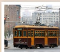
นั่งรถรางชมเมืองต้าเหลียน