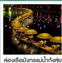
ล่องเรือมังกรแม่น้ำก้งซุย