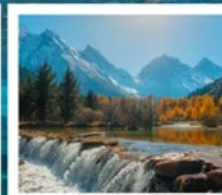
อุทยานปีงเิ่งโกว