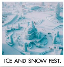
ICE AND SNOW FEST.

คฤหาสน์วอลการ์ (ฟรีเล่น Snow Tubing) โบสถ์เซนต์นิโคลัส / มู่ตันเจียง / ชมแสงสีกลางคืนถนนเส่ยุนเจีย เขาแกะหญา / เขาปังงดูย / ภาพเขียนสี ICE AND SNOW โบสถ์เซินไซเฟีย / เกาะพระอาทิตย์ / เทศกาลแกะสลักน้ำแข็ง