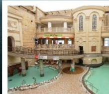
HAWAII SPA RESORT