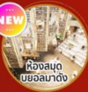
ห้องสมุด บยอลมาดิง