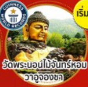
วัดพระนอนไม้จันทร์หอม วาจุงงซา