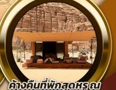
ค้ำคืนที่พักสุดหรู ณ Habitat AlUla 2 คืน

พิเศษ!! รับประทานอาหาร ณ ภัตตาคารอาหารไทย สุดหรูและไฮโซ @Saffron Banyan Tree AlUla