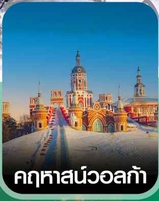
คฤหาสน์วอลก้า