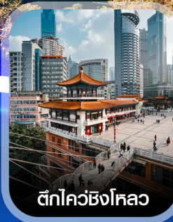
ตึกไคว่ซิงไหลว

✈️ คอนเฟิร์มออกเดินทาง ทุกพีเรียด 2 ท่านขึ้นไป