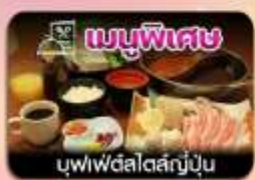
เมนูพิเศษ บุฟเฟ่ต์สไตล์ญี่ปุ่น

ชิบโปโร-ชมทุ่งดอกลาเวนเดอร์-โทมิตะฟาร์ม-ซิกิไซโนะโอะกะ-น้ำตกชิราอิเกะ-บ่อน้ำสีฟ้า-อิสระช้อปปิ้งเต็มวัน-พักออนเซน