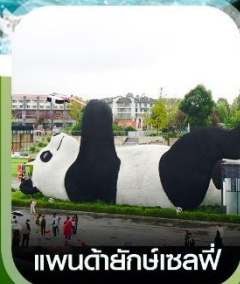
แพนด้ายักษ์เซลฟ์

คอนเฟิร์ม ออกเดินทาง ทุกพีเรียด 2 ท่านขึ้นไป