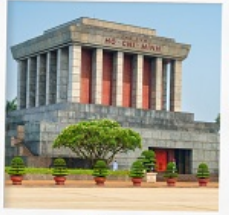
สุสานโฮจิมินห์