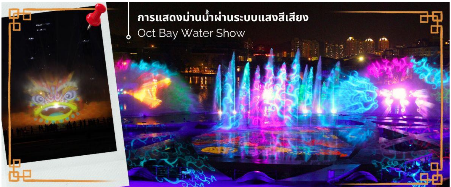
การแสดงม่านน้ำผ่านระบบแสงสีเสียง Oct Bay Water Show

จากนั้นนำท่าน ชมการแสดงม่านน้ำผ่านระบบแสงสีเสียง OCT BAY WATER SHOW เป็นโชว์ม่านน้ำแบบ 3 มิติ ที่ใช้ทุนสร้างกว่า 200 ล้านบาท จัดแสดงที่ OCT BAY Water Show Theatre Shenzhen ซึ่งเป็นโรงละครทางน้ำขนาดใหญ่ที่สามารถจุได้ถึง 2,595 คน เป็นโชว์ที่เกี่ยวกับเด็กหญิงผู้กล้ากับลิงวิเศษที่ออกตามหาเครื่องบรรเลงเพลงที่มีชื่อว่าปี่แห่งความรัก เพื่อเอามาช่วยนกที่ถูกทำลายจากมนต์ (มลพิษ) ในป่าโกงกาง การแสดงใช้อุปกรณ์ เช่น แสงเลเซอร์ ไฟ เครื่องแปลงแสง ม่านน้ำ ระเบิดน้ำ กว่า 600 ชนิด เป็นโชว์น้ำที่ใหญ่และทันสมัยที่สุดในโลก