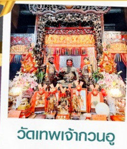
วัดเทพเจ้ากวนอู