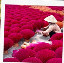
หมู่บ้านรูป