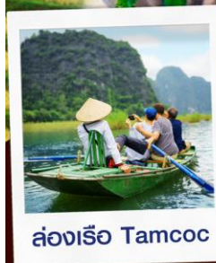
ล่องเรือ Tamcoc