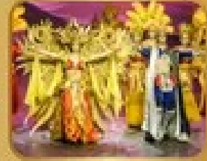
ชมการแสดงโขน