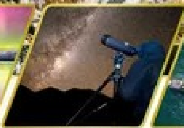
กิจกรรมชมทิวทัศน์ดาว