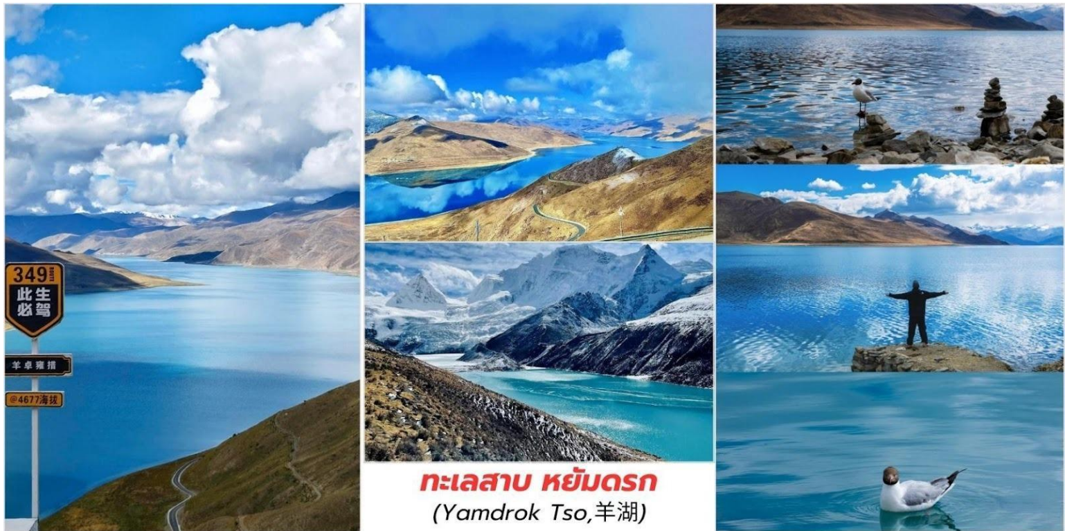
อย่างสวยงาม (ไม่รวมค่าบริการ)

จากนั้นนำท่านชม ทะเลสาบ หยัมดรอก (Yamdruk Tso, 羊湖) หรือที่ชาวทิเบตเรียกว่า หยัมดรอกยุมโซ เป็นหนึ่งในสามทะเลสาบศักดิ์สิทธิ์ ที่ยิ่งใหญ่ที่สุดของทิเบต (ร่วมกับทะเลสาบนามูโซและมานาซาโรวาร์) ความงดงามของทะเลสาบแห่งนี้คือสีฟ้าครามหรือ สีเทอร์ควอยซ์อันเป็นเอกลักษณ์ที่ตัดกับฉากหลังของภูเขาหิมะที่ปกคลุมตลอดปี ทำให้ที่นี่ได้รับสมญานามว่าเป็น "อัญมณีที่พระเจ้าประทานให้" บนหลังคาโลกเมื่อแสงแดดกระทบน้ำจะเปลี่ยนเฉด จากฟ้าแก่เป็นเขียวมรกต โดยมีพื้นหลังเป็นภูเขาหิมะหรือหิมะละลาย ทำให้รู้สึกถึงความสงบ และความยิ่งใหญ่ ของดินแดนหลังคาโลกแห่งนี้ อีสาระให้ท่านได้ถ่ายภาพทะเลสาบสีเทอร์ควอยซ์ด้านล่างตัดกับยอดเขา หิมะที่ปกคลุม ได้วิวกทะเลสาบบนที่สูงแบบ "เหนือเมฆ" หรือ ถ่ายภาพกับ จามรี (Yak) และ สุนัขทิเบตมาสตีฟฟ์ (Tibetan Mastiff) ที่ประดับประดา