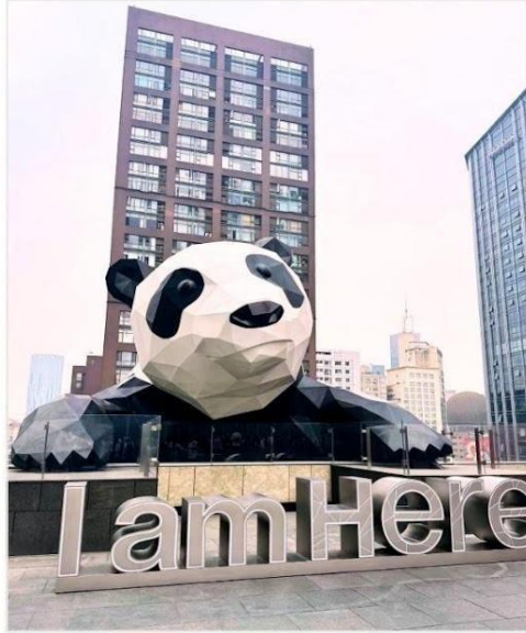
หมีแพนด้ายักษ์ กำลังป็นตึก IFS