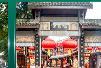
ช้อปปิ้งย่านเจียงฟางเม่ย