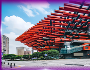
แลนด์มาร์กจิ้ง ตึกตะเกียบ