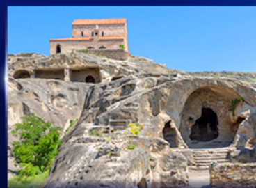
เมืองถ้ำโบราณ อุปลิสซิค