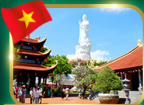
พระพุทธรูปวัดถ้ำอภัย