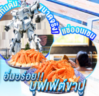
อิ่มอร่อย!! บุฟเฟ่ต์งาบู

ราคาเพียง 58,888 รวมภาษีมูลค่าเพิ่ม 7% (รวมจกนคปร.มท.น)