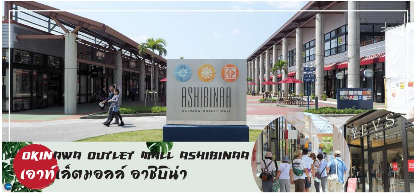
OKINAWA OUTLET MALL ASHIBINAA เอาท์เลตมอลล์ อาชิบิโน่า

รับประทานอาหารเช้า ณ ห้องอาหารของโรงแรม (5) นำท่านเดินทางสู่ ศาลเจ้านะมิโนะอุเอะ (Naminoue Shrine) (ใช้เวลาเดินทางประมาณ 10 นาที) ตั้งอยู่ ณ บริเวณที่เป็นพื้นที่ศักดิ์สิทธิ์ที่ใช้ในการสวดภาวนาอธิษฐานต่อเทพเจ้าที่สถิตย์อยู่ ณ อาณาจักรเจ้าสมุทรโพ้นทะเลมาแต่ครั้งโบราณ ในอดีตชาวเรือที่เข้าออก ณ ท่าเรือนาสะ (Naha Port) ซึ่งขณะนั้นเป็นศูนย์กลางการแลกเปลี่ยนค้าขายกับนานาประเทศ ทั้งจีน ประเทศทางตอนใต้ เกาหลี และชวายามาโตะ มักจะแหงนหน้ามองขึ้นไปยังศาลเจ้าซึ่งตั้งอยู่บนหน้าผาสูงเพื่ออธิษฐาน และแสดงความขอบคุณ ศาลเจ้านะมิโนะอุเอะได้รับความเสียหายจากการรบในโอกินาวะ (Battle of Okinawa) เมื่อครั้งสงครามแปซิฟิก แต่ได้รับการบูรณะฟื้นฟูในเวลาต่อมาเมื่อสงครามสิ้นสุดลง ปัจจุบันนี้ได้กลายมาเป็นศูนย์กลางแห่งศาสนาชินโตในจังหวัดโอกินาวะ ชาวญี่ปุ่นมักจะมาไหว้ขอพรเกี่ยวกับธุรกิจการงานให้เจริญรุ่งเรือง ร่ำรวย และมาสะเดาะเคราะห์ให้พ้นโชคร้าย จากนั้นนำท่านสู่ เอาท์เลตมอลล์ อาชิบิโน่า (Okinawa Outlet Mall Ashibinaa) (ใช้เวลาเดินทางประมาณ 30 นาที) เอาท์เลตแห่งแรกในโอกินาวะ รวบรวมร้านค้าชั้นนำกว่า 100 ร้าน ทั้งเสื้อผ้าแฟชั่น สินค้าแบรนด์เนม นาฬิกา ข้าวของเครื่องใช้ ของเล่น ทุกร้านจัดเต็มทั้งสินค้านำเข้าและรุ่นใหม่ ลดราคากระหน่ำกว่า 30-80% ให้ได้เดินช้อปปิ้งท้ายทวีปกันอย่างจุใจ ภายใต้บรรยากาศสบายๆ สไตล์รีสอร์ทริมทะเล หากช้อปปิ้งจนเหนื่อยสามารถขึ้นไปทานอาหารที่ชั้น 2 มีอีกหลายร้านที่คอยให้บริการ