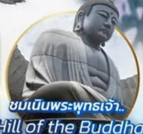
ชมเนินพระพุทธรเจ้า.. Hill of the Buddha

📍 ไฮไลท์!! สนุกสนานกับกิจกรรมทะเลหิมะ- ณ ลานสโนว์ เวิลด์ ฮักไซฟาโนรามา เยี่ยมชมเนินพระพุทธรเจ้า ชมความน่ารักเหล่าสัตว์ ณ สวนสัตว์อาซาฮิยาม่า ชมคลองโอดาธา เข้าชมพิพิธภัณฑ์ถ้ำถ้ำสองดนตรี สัมผัสธารน้ำแข็ง ณ หมู่บ้านราเมนอาซาฮิคาว่า ช้อปปิ้งจุใจ กาบุกุโคโนจิ อีเมอร์ออย!! บุปเฟ่ต์ซาบุมุ และซาบูยักซี่