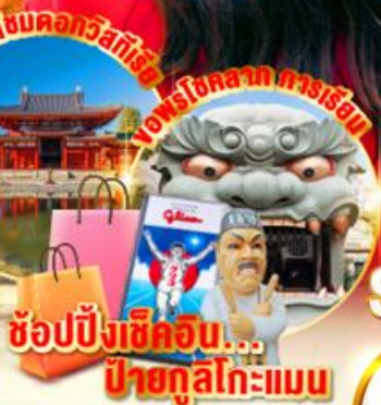
ช้อปปิ้งเซ็คชั่น... ป้ายกุสึโกะแมน