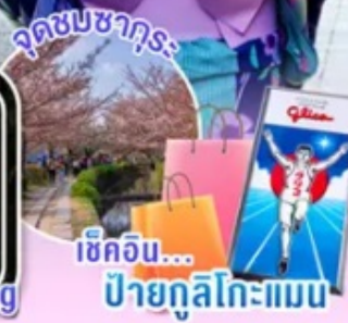
ช้อปปิ้ง... ป้ายกูลิโกะแมน