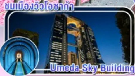
Umeda Sky Building