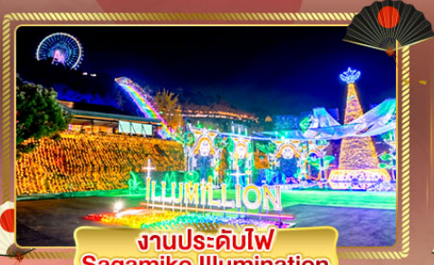
งานประดับไฟ Sagamiko Illumination