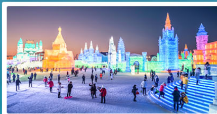
เทศกาลน้ำแข็งฮาร์บิน