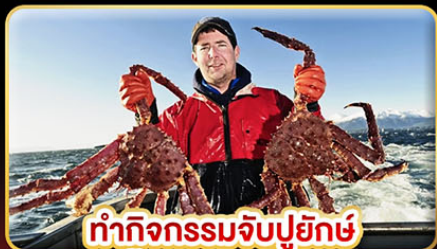
ทำกิจกรรมจับปูยักษ์ "พร้อมเมนูสุดพิเศษ"