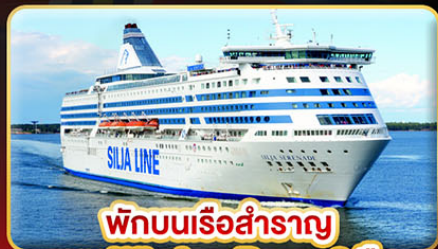
พักบนเรือสำราญ แบบ Window Room 2 คืน