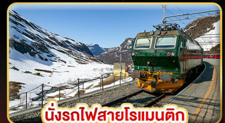
นั่งรถไฟสายโรแมนติก "พร้อมสปา"