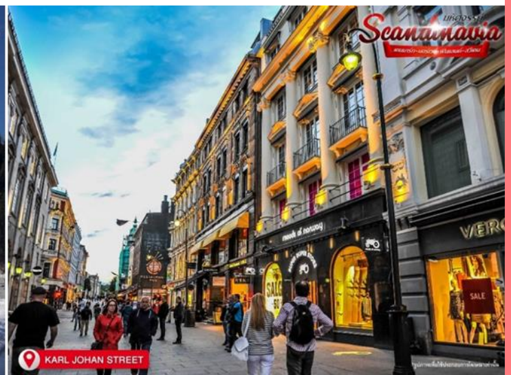
KARL JOHAN STREET