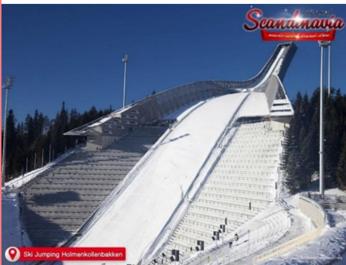
Ski Jumping Holmenkollenbakken

อิสระช้อปปิ้ง ณ ถนนคนเดินคาร์ลโจฮัน (Karl Johan street) แหล่งช้อปปิ้งที่มีชื่อเสียงที่สุด ของนอร์เวย์ ตั้งอยู่กลางกรุงออสโล มีสินค้าทุกอย่างให้ได้เลือกซื้อ ของฝากของขวัญที่น่าซื้อก็ คือ ผลิตภัณฑ์จากขนสัตว์ น้ำมันปลา เนยแข็งเทียนไข และของที่ระลึก เช่น เรือไวกิง หรือตุ๊กตา Troll ตุ๊กตาพื้นบ้านของนอร์เวย์ เครื่องครัว พวงกุญแจ เป็นต้น สินค้าและ ของที่ระลึกต่างๆ ราคา ค่อนข้างสูง เนื่องจาก นอร์เวย์เป็นอีกหนึ่งประเทศที่มีค่าครองชีพสูงที่สุดในโลก แต่ก็ จะมีช่วงลด ราคาสินค้าปีละ 2 ครั้ง ได้แก่ ช่วงเดือนมกราคม-กุมภาพันธ์และเดือนมิถุนายน - กรกฎาคมซึ่งจะ ลด 50-70 เปอร์เซ็นต์เลยทีเดียว