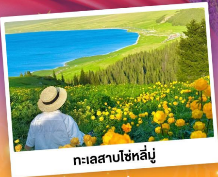
ทะเลสาบไซไห่หลู่