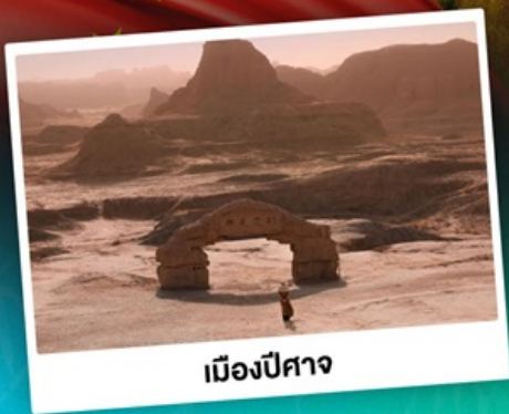
เมืองปีศาจ