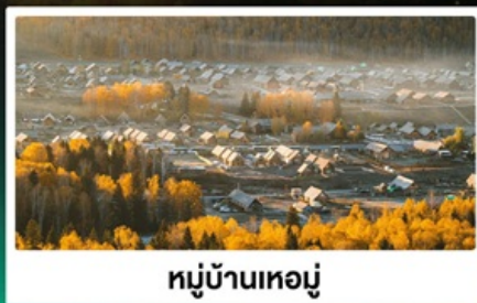
หมู่บ้านหอย