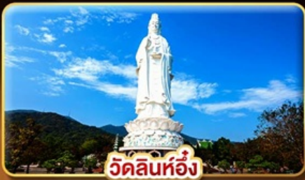
วัดลินห์ฮอี่ง