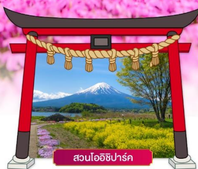
สวนโออิชิปาร์ค