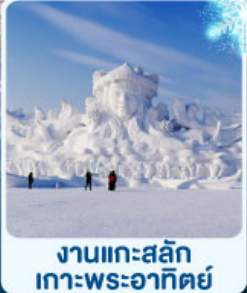
งานแกะสลัก เกาะพระอาทิตย์