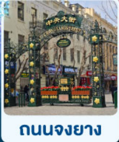
ถนนจงยาง