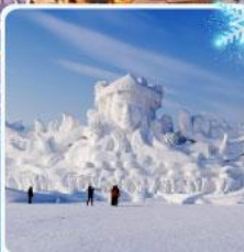
งานแกะสลัก เกาะพระอาทิตย์